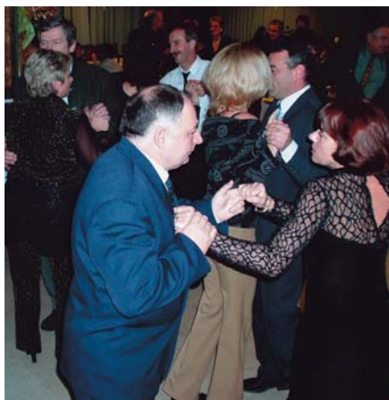
A Rulett együttes szolgáltatta a talpalávalót

zogni. A „táncparkett” az első taktusokra megtelt, a vendégek lankadatlan figyelemre készítették a Rulett együttes