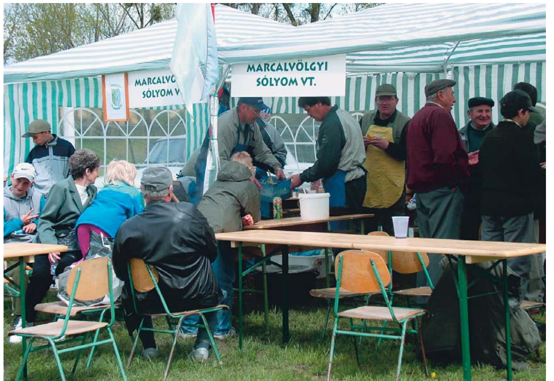
Évek óta legnagyobb sikerrel a vadászok főzőversenye zajlik. Ezúttal 14 vadásztársaság kínálta a jobbnál jobb ételket

Ahogy azt már korábban megszoktuk, a legnagyobb érdeklődés ezúttal is a főzőversenyt övezte, amelyre 14 vadásztársaság nevezett. Szinte mindenféle vad került a kondérokba. Győztest nem hirdettek, hiszen mindegyik szakácscsapat kitétt magáért, ezért egy serleggel térhettek haza. Az eredményt a „kóstoló bizottság”, vagyis a látogatók díjazták, azzal, hogy az ételket mind egy szálíg elfogyasztották. Egészségükre!