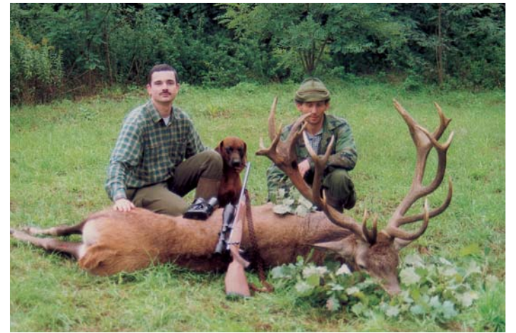
Erre a tróféára a vendégvadász, a kísérője, és az egész vadásztársaság is büszke lehet

A vadásztársaságnak az elmúlt években komoly feladatot jelentett a nagyvadállomány gyérítése. Öt évvel ezelőtt még 100-120 közötti számban lótték a gímszarvast, az őzet és a vaddisznót is. 2001-ben és 2002-ben viszont már 559 nagyvadat ejtettek. Az idei évben