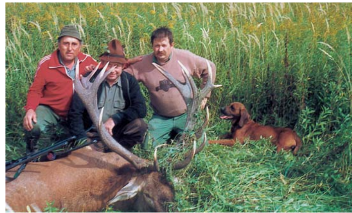
Ilyen és ehhez hasonló 12 kiló fölötti bikák gyakran kerülnek terítékre a Marcal-Bitva-közi Vadásztársaságnál

Az őzállomány 550, a disznóállomány 300 darabos. A területükön van egy majd 250 hektáros disznókertjük, ahol 60–70 darab vaddisznó lehet. Az apróvadállomány kevés, nyúl szinte nincs a területen, a fogoly, a fácán szerencsére feljövőben van. Éveken keresztül foglalkoztak fácánneveléssel, de az idén befejezték,