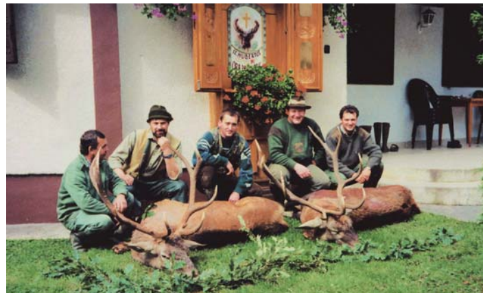
A társaság fő bevételi forrása a nagyvad vadászat lett

Az elnök fontosnak tartotta, hogy a vadásztársaságok, mint egyesületek fennmaradjanak, de az is látszik, a jelenlegi formájukban nem biztos, hogy sikerül ezeket megtartani. Ez egy olyan jelentős civil fórum, ami jelentős kihatással van a környezetvédelemre is. Sajnálatosnak tartaná, ha a vadásztársadalom teljesen elanyagiasodna. Szeretné, ha a jogi szabályozás, a vadászatot, mint szórakozási lehetőséget elérhetővé tenné az emberek számára, s a civil szervezetek tovább tudnak működni.