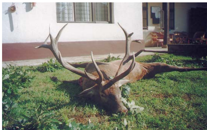
A tavalyi megyei rekorder bikát az osztrák Kurt Wilde lótte

Az éves tervük szerint 100-110 szarvast ejtenek el, amiből 25-28 a bika. Az idén nem volt köztük aranyérmes tróféájú. Őzből 150-et lóttek, köztük 45 bakot, de ebből sem akadt arany. Disznóból 170 a terv. Egyébként pár éve meg 300-at lóttek belőle, de az állomány mára rendkívüli módon lepadt. Az idei kilövésekkel 120-nál tartanak. A disznókárokon is látszik a csökkenés, az idén például a kukoricát nem túrtá ki. A vadászok kijelentették, a területen nincs túlszaporodott vadállomány, főleg most, hogy a disznók száma radikálisan csökkent. Éppen ezért abban érdekeltek, hogy a jelenlegi szint minimálisan megmaradjon. Szerintük szakmai szelekcióval javítani kell a szarvasállomány minőségén.