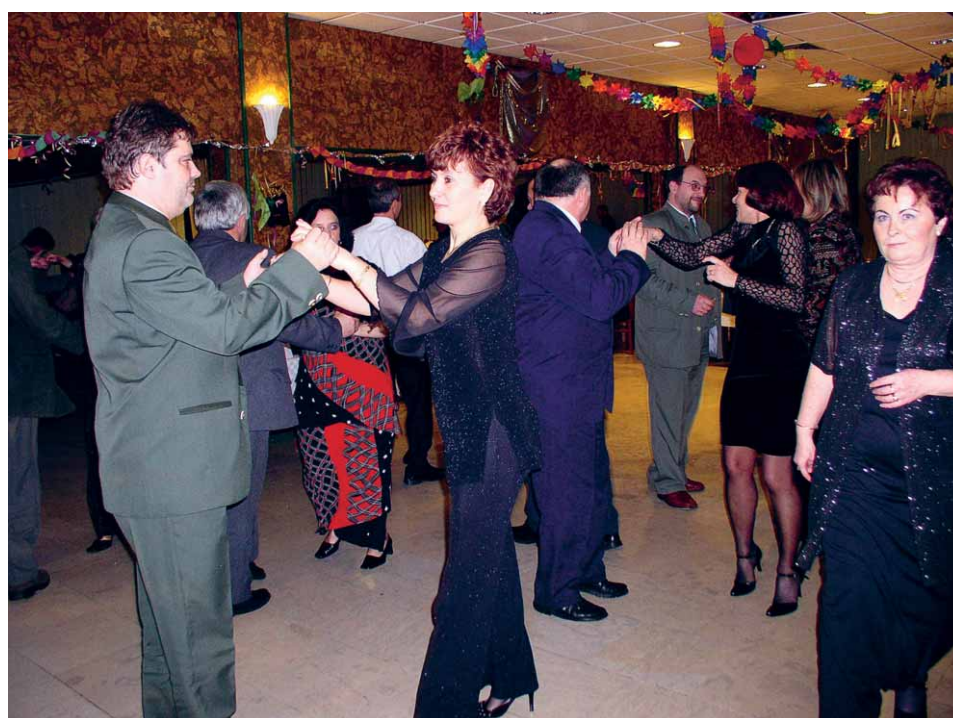
A hangulatra egyik évben sem lehetett panasz

Még csak öt éves múltra tekinthet vissza az újkori vadászbálok története, de egyre inkább beívódik az emberek (s nemcsak a vadászok!) tudatába. Ez az a rendezvény, ahol jelen kell lenni, a hangulat fantasztikus, az ételsor