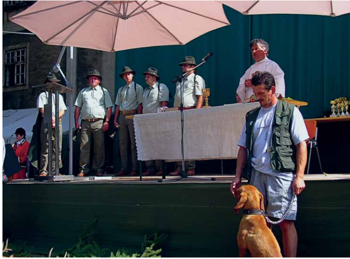
A sümegiek örömmel fogadták az ünneplő vadászok megjelenését a városban. Nagyszabású nyitóünnepség volt

A vadászkürt hívó szavára sokan megálltak. A kürtösök a vadászhimnuszot fújták, ami ünnepi eseményt jelzett. Az idei évi Veszprém megyei vadásznapot ezúttal Sümegen, a hagyományos Szent Jakab Nap keretében tartottuk.