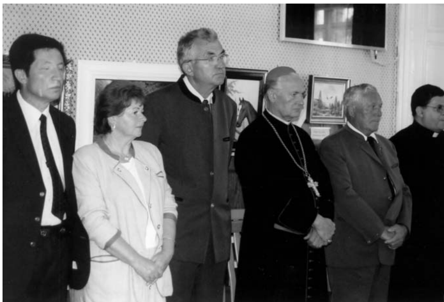
A vadásznapi rangos vendégei a képzőművészeti kiállítás megnyitóján