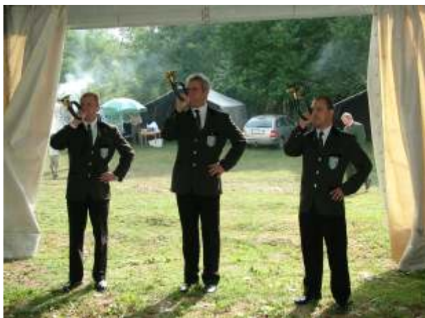
Szólnak a vadászkürtök