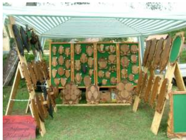
Sokféle trófea alátét közül lehet válogatni