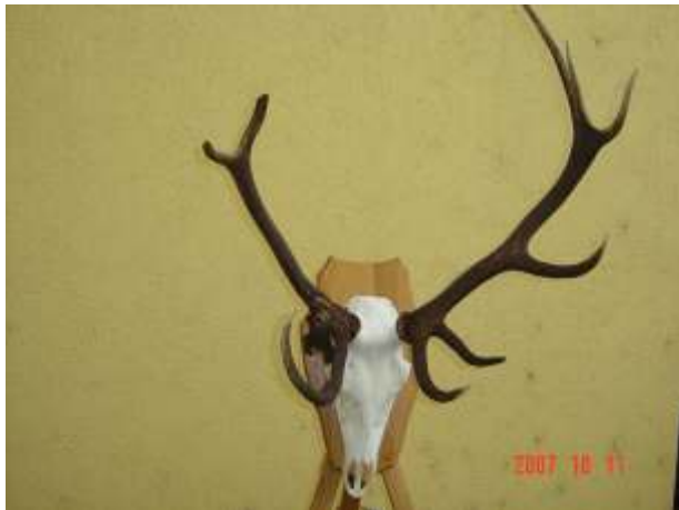
Bárányosi Fvk., 4,85 kg