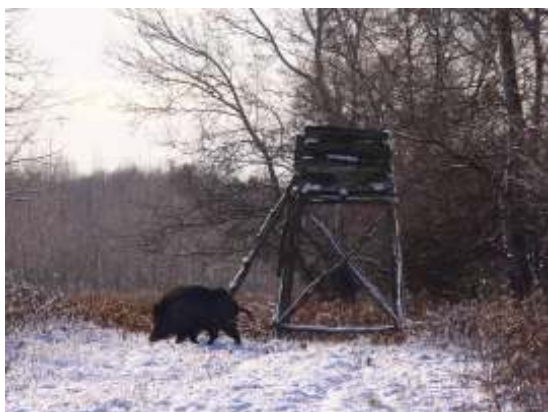
Egy téli vadászalom