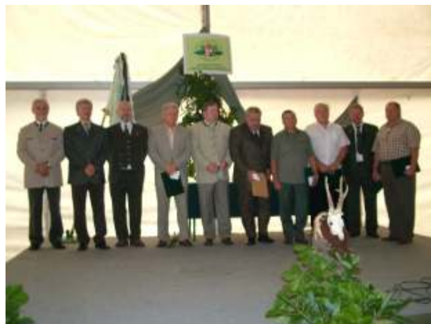
A megyei vezetőség és a kitiüntettek