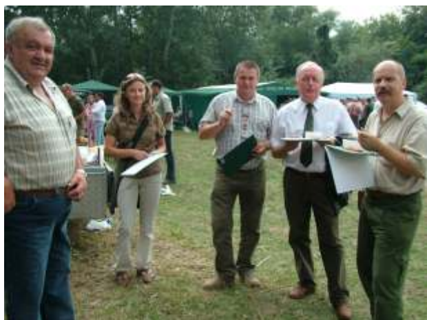
A zsűri az Etei Kossuth Vt. főtérén