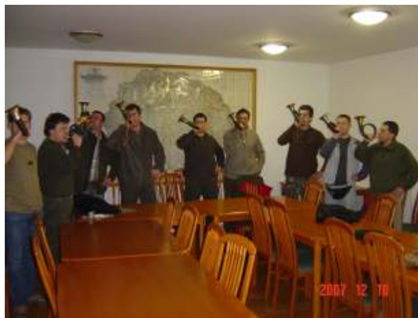
A kiirtős tanfolyam hallgatói

A vadászkiirtős képzést 15 f vel elindítottuk. A tanfolyam minden hétfőn 18,00-20,00 óra között kerül megtartásra . Az oktatás folyamatos, bármikor lehet csatlakozni. Kamarai tagjaink részére a képzés térítésmentes.