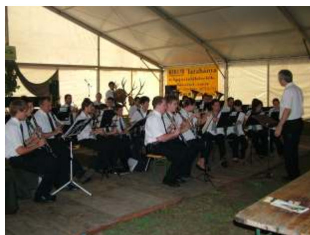
A Tatabánya Városi Fesztivál Fúvószenekar