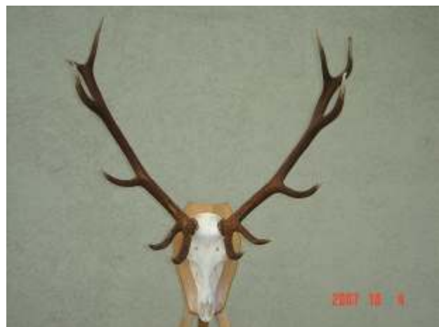
Vértesi Erd Zrt. 6,62 kg