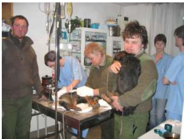
A segítő vadásztársak csapata