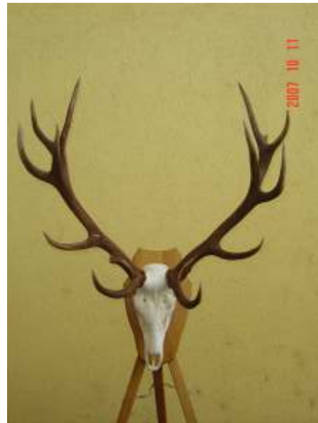
Bajnai Tölgyfalevél Vt., 7,55 kg