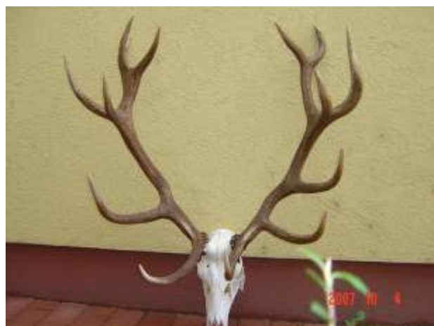
Bábolna Zrt., 11,27 kg