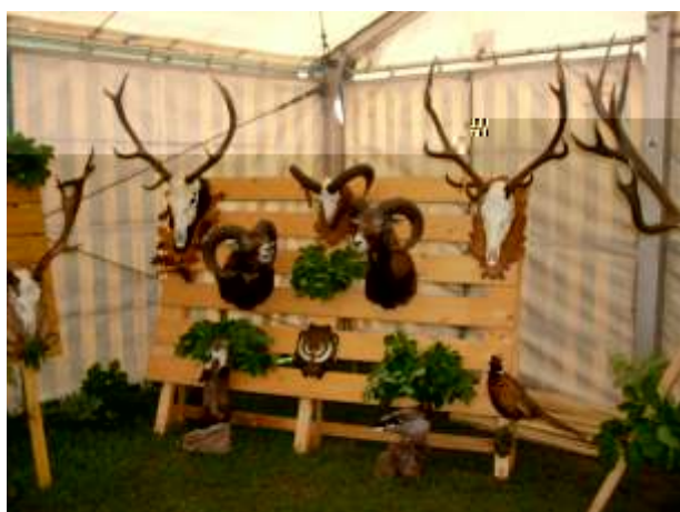
Részlet a trófeakiállításból