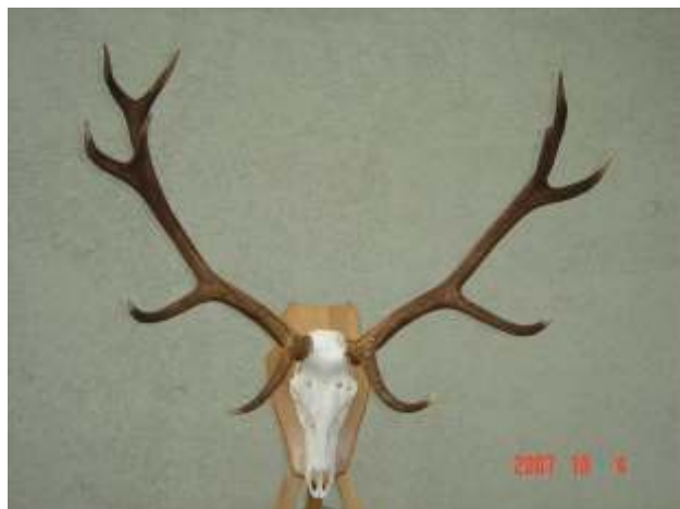
Vértesi Erd Zrt., 6.87 kg