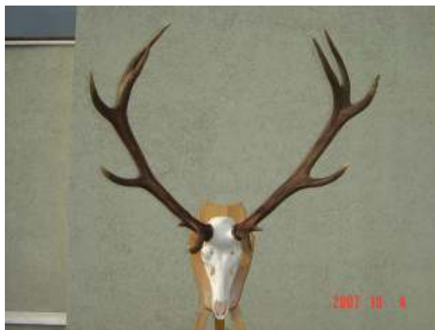
Császári Gazdák Vt., 8,01 kg